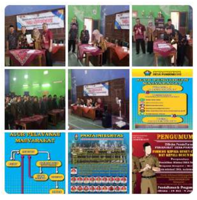
Foto Lihat Semua Foto